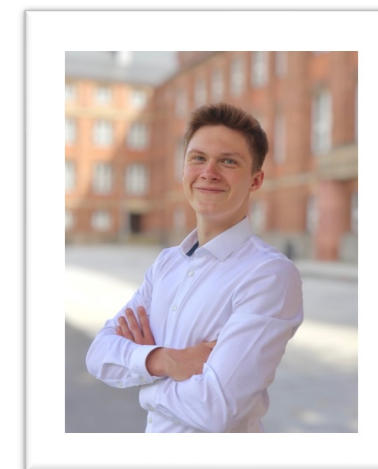
Felix Rother Kooperationen