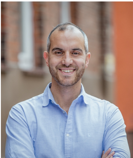
Belit Onay - Oberbürgermeister der Stadt Hannover